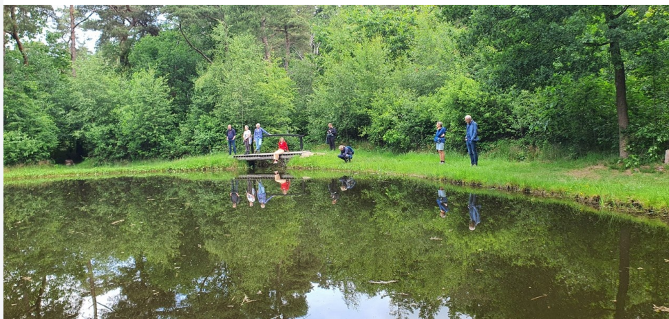
Sfeerbeeld: lunchpauze tijdens de wandelretraite